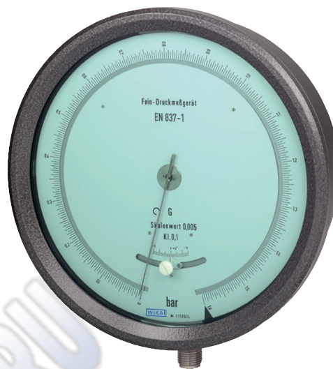
Исполнение тестовых манометров Модель 342.11